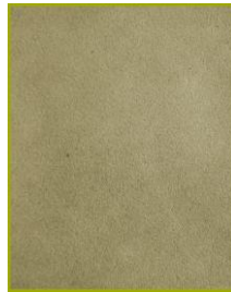
Baby Camurça cor bege