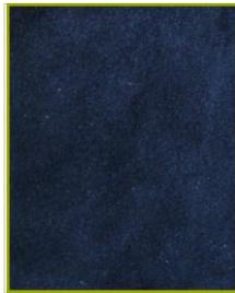
Baby Camurça cor azul

Está autorizada a utilizar o rótulo Biocalce Cuidado Extra, em pele para calçado com forro de acordo com as especificações deste rótulo, expressas no boletim de ensaios: BA - 2785/2012 de 18/07/2012 e BA-3269/2012 de 21/09/2012 para os seguintes artigos: