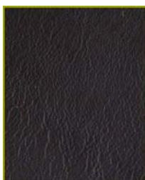
Baby Napa cor azul